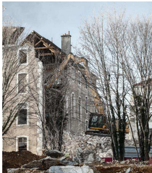
Le chantier sera livré en novembre 2019.

Service à appel gratuit ou par mail à lerlirouge@estrepublikain.fr