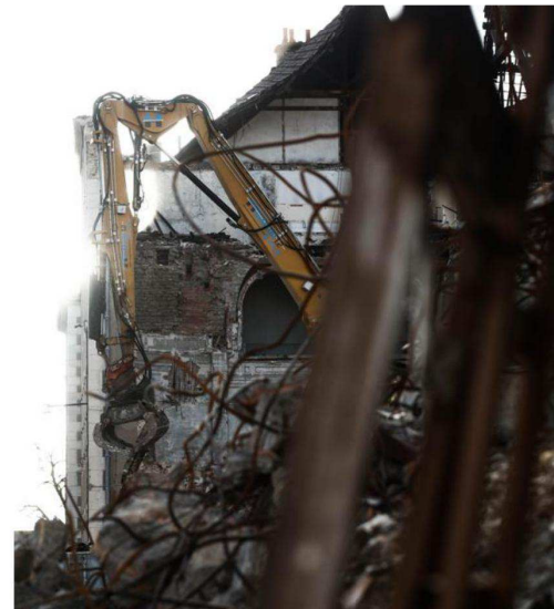
Les travaux commenceront fin février début mars.